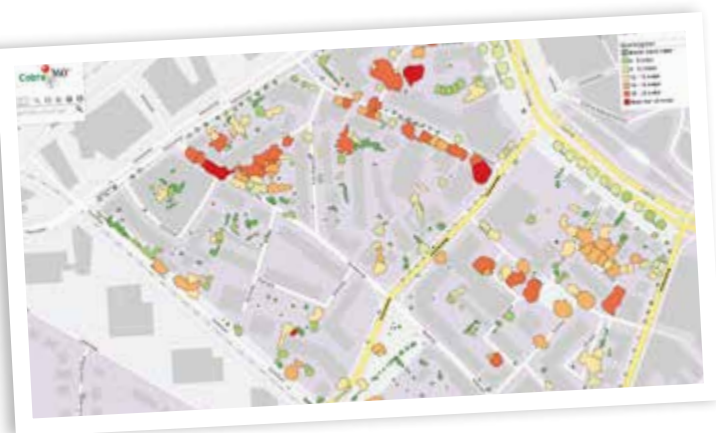
▲ Boomregister in Cobra 360+ KaartViewer