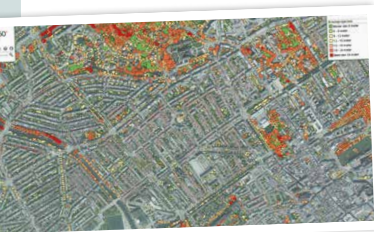
▲ Boomregister deelgebied Den Haag

Cobra adviseurs staat bekend om zijn innovatieve karakter. Denk bijvoorbeeld aan innovaties zoals de boomtrekproef, de hoogtecamera of de 3D-omgevingsscanner voor het in beeld en in kaart brengen van de buitenruimte. En Cobra is nog lang niet klaar met innoveren. De nieuwste ontwikkelingen vinden plaats binnen het Cobra 360+ Platform en niet te vergeten het 'Boomregister.nl'.